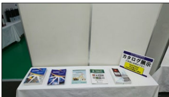
図 カタログ展示のイメージ

2025年度春季大会ウェブページ : https://2025-03spring.jspe.or.jp/